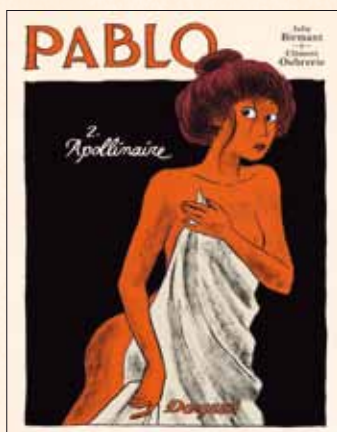
T.2 sortie le 7 septembre 2012